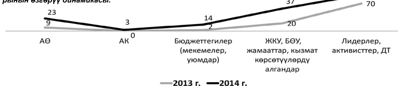
2013-2014-ж.ж. жергиликтүү демилгенин булактарынын өзгөрүү динамикасы.

Демилгелер бир жолку мүнөзгө ээ эместигин белгилей кетүү маанилүү, анткени көп учурда жергиликтүү демилге – бул активдерди түзүү, кийин жергиликтүү кызмат көрсөтүүлөрдүн инфраструктурасына акча кошууну, физикалык абалын колдоп турууга үзгүлтүксүз каржылоону, көбөйтүүнү (адатта болуп келгендей, мисалы, бала бакчаны андан ары кеңейтүү, тазаланган каналдардын узундугун көбөйтүү ж.б.) талап кылат. Дээрлик ар бир ушундай демилге иштеп турууну камсыздоону да талап кылат (тийиштүү кызмат көрсөтүүлөр үчүн акы: коммуналдык кызмат көрсөтүүлөр, жаңы объекттердин кызматкерлеринин эмгек акысын төлөө ж.б.). Бул ракурстан алганда ЖӨБ органдарын муниципалитеттердин аймагындагы БАРДЫК демилгелердин катышуучусу деп атаса болот. “Жергиликтүү демилге” сынагы ошондой эле жергиликтүү жамааттардын жергиликтүү өз алдынча башкаруу органдары менен өнөктөштүктө жергиликтүү бюджеттеги каражаттын эсебинен жергиликтүү маанидеги маселелерди чечүүнү каржылоосунда өсүштү