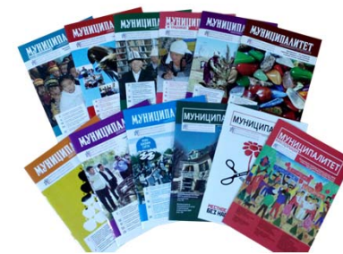
Проект «Голос граждан и подотчётность органов местного самоуправления: бюджетный процесс» финансируется Правительством Швейцарии и выполняется Институтом политики развития