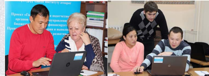
Проект «Голос граждан и подотчётность органов местного самоуправления: бюджетный процесс» финансируется Правительством Швейцарии и выполняется Институтом политики развития