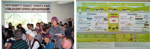
Проект «Голос граждан и подотчётность органов местного самоуправления: бюджетный процесс» финансируется Правительством Швейцарии и выполняется Институтом политики развития