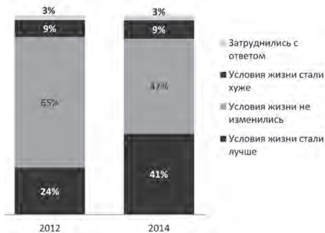
Диаграмма 3. Мнение граждан о воздействии Проекта ГГПОМСУ на условия жизни в пилотных областях