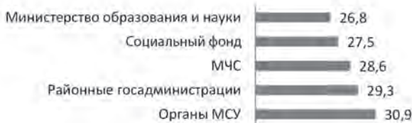
Диаграмма 1. Индекс доверия граждан, 2014 г.